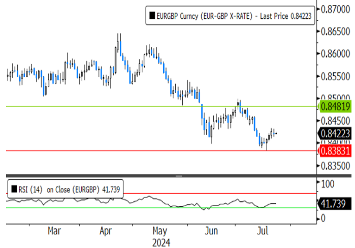
歐羅兌英鎊日線圖