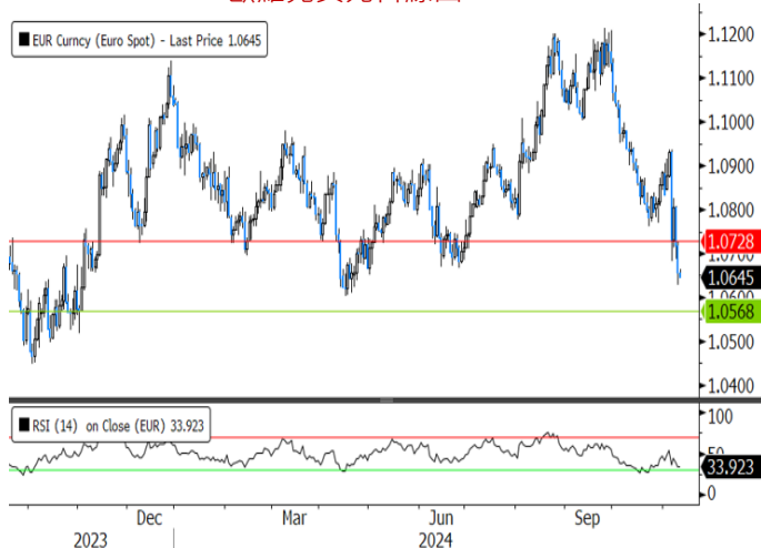
歐羅兌美元日線圖