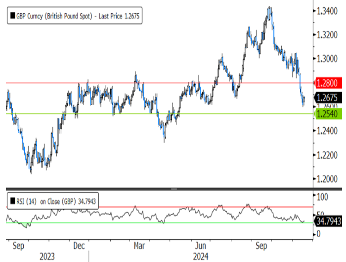
英鎊兌美元日線圖